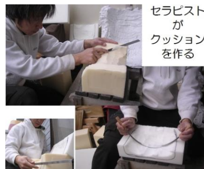
セラピスト が クッション を作る

このようなひとつではない身体状況に対応する、世界中のシーティング・フィッティングを用いた技術を身につけましょう。